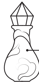
Пузырек с туманом

Сканируй QR-код и узнай как сварить магическое зелье!